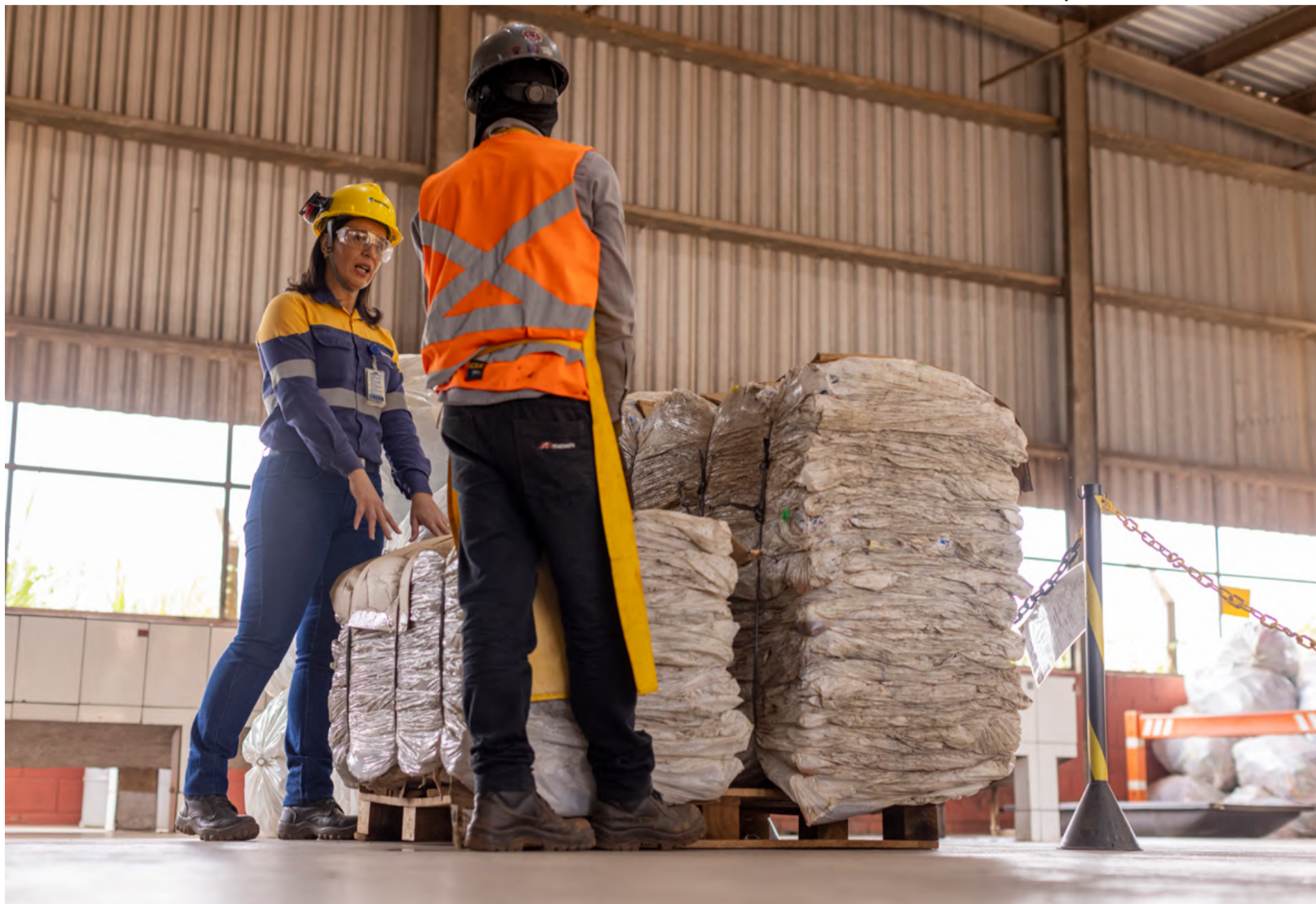
CENTRO de Materiais Descartados (CMD) no Complexo de Germano (MG)