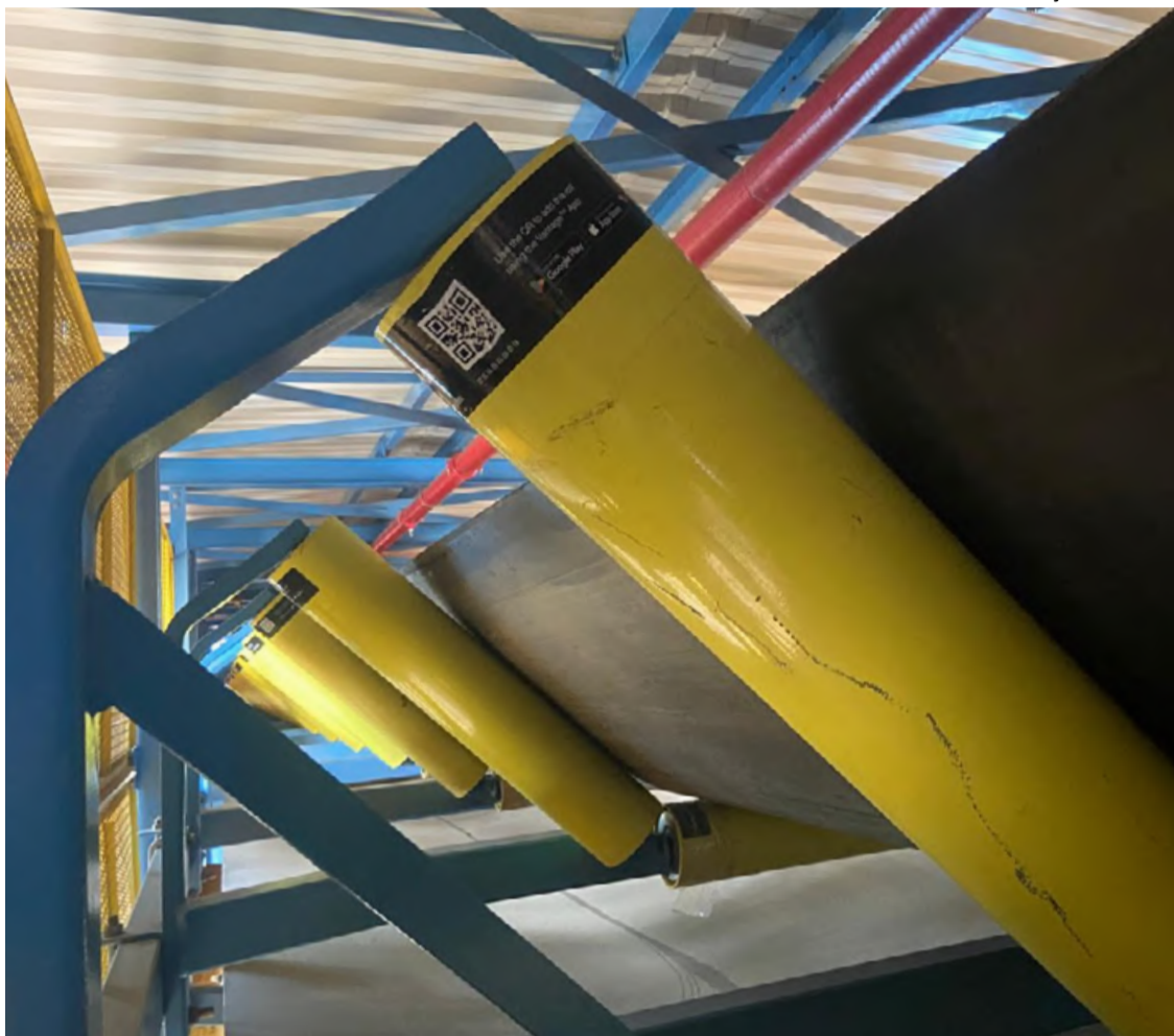
ROLETES inteligentes da Suzano Unidade Aracruz

"Um dos principais modos de falha em fábricas de celulose são incêndios em correias transportadoras de cavacos causados por falhas em roletes. Quando esses caminhos são bloqueados, toda a produção de celulose é interrompida, podendo ter seus efeitos alastrados por semanas", afirma Cavessana.