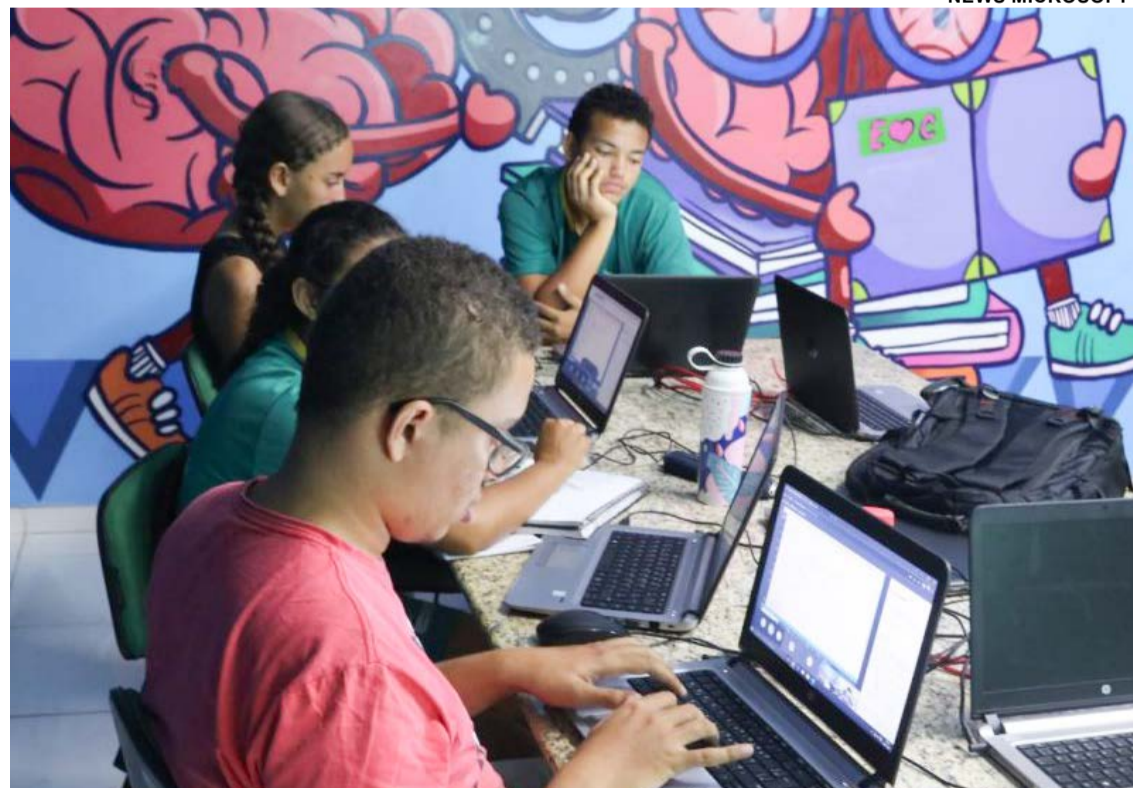
Alunos das Estações Conhecimento , mantidas pela Fundação Vale

“Para nós, da Fundação Vale, é extremamente importante valorizar parcerias como essa,