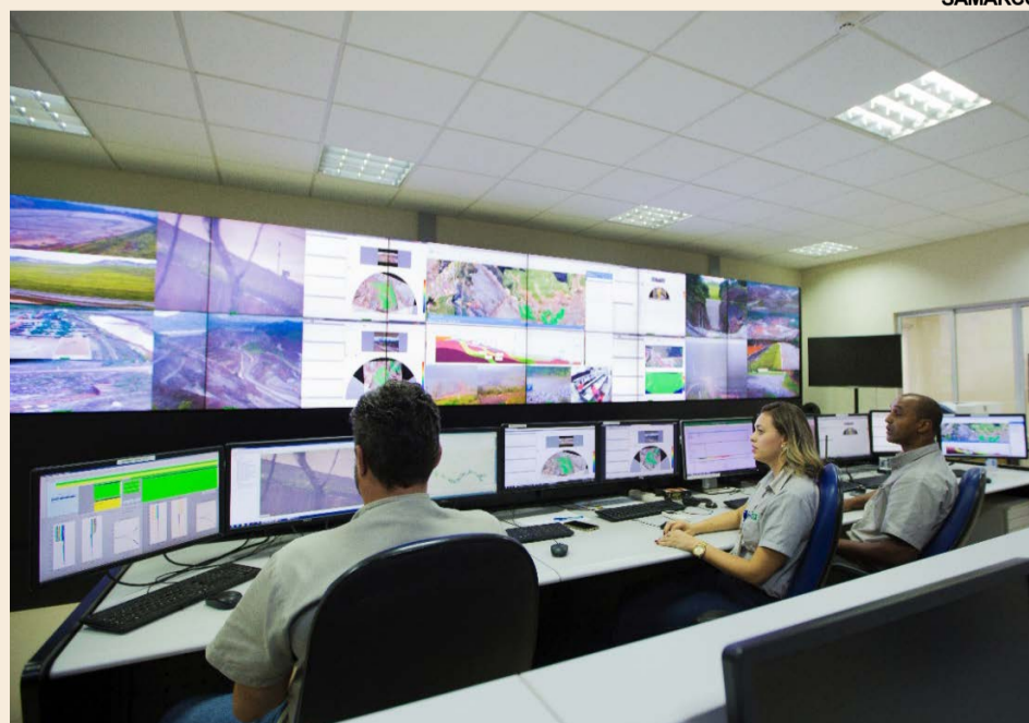
SAMARCO , sala de monitoramento