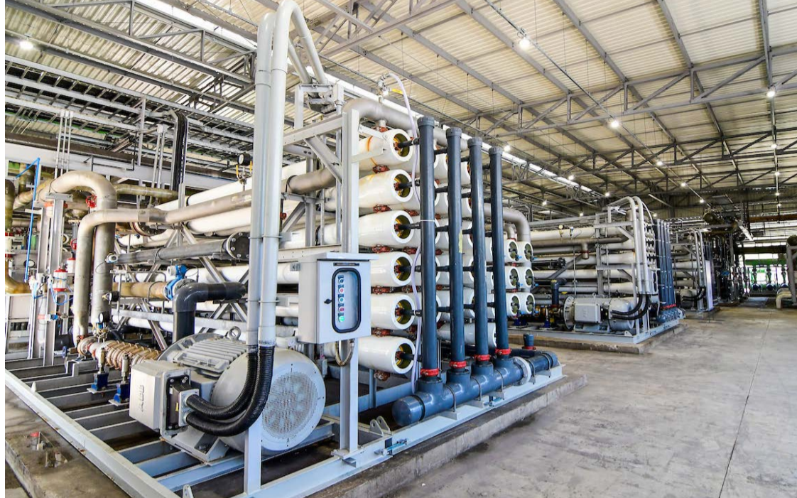
ArcelorMittal Tubarão , usina de dessalinização

A usina de dessalinização de água do mar da ArcelorMittal Tubarão foi eleita o “Melhor Projeto de Responsabilidade Social Corporativa” pela IDA - International Desalination Association, principal recurso do mundo para informações e