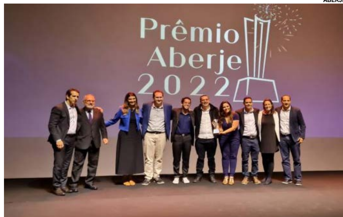
Executivos e equipe de Comunicação e Marca da Gerdau

“Para mim, é uma alegria ser homenageado pela Aberje como CEO Comunicador do