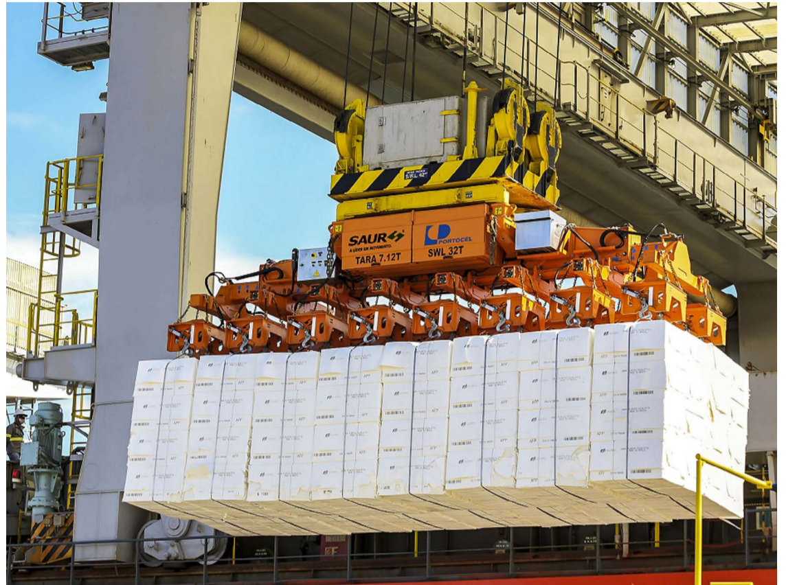
Spreader automático , engate automático dos fardos de celulose

“O Portocel está sempre em busca de aplicações inovadoras na área portuária e soluções logísticas em geral. Além disso, nos atentamos constantemente às boas práticas de inovação em diferentes setores, como,