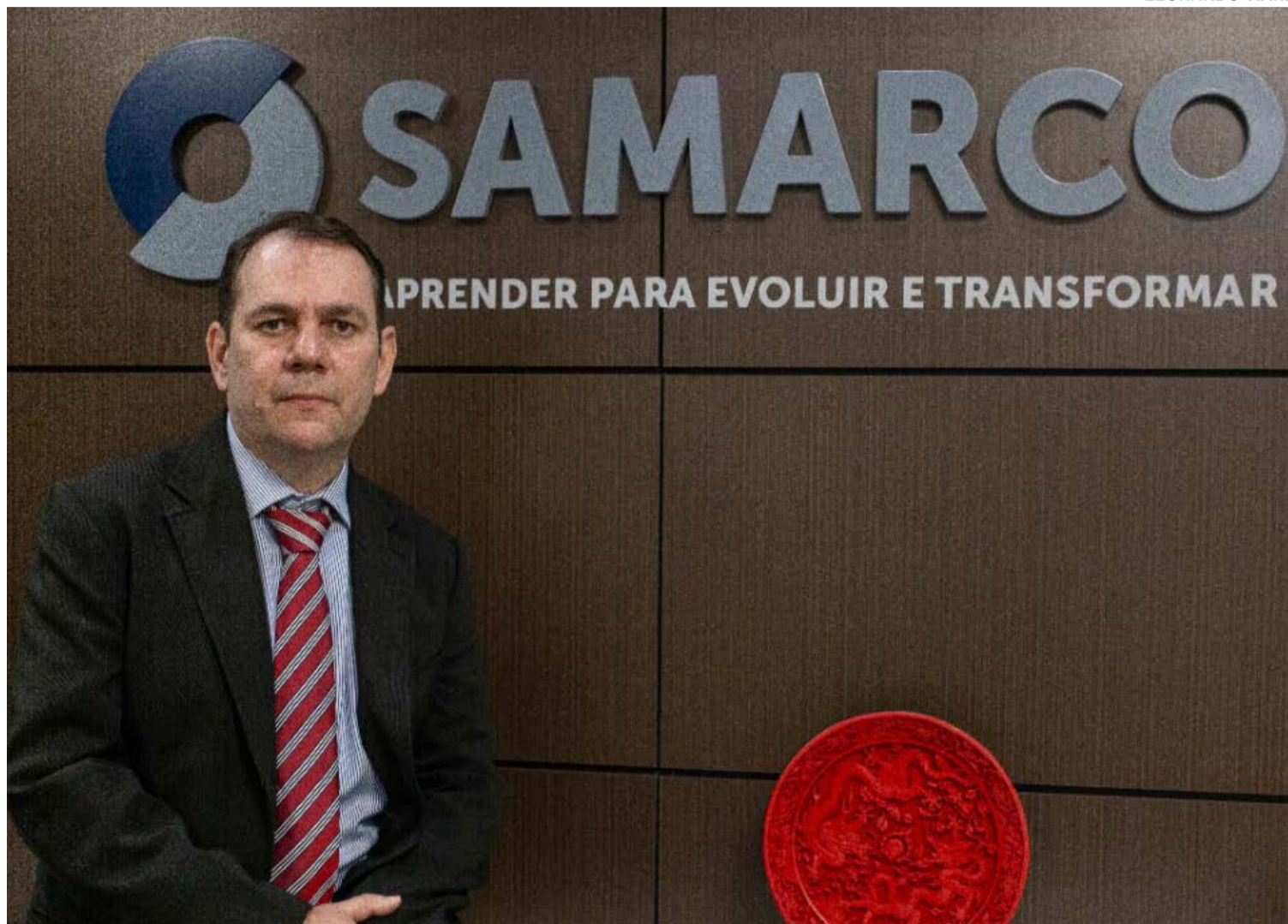
RODRIGO VILELA , Presidente da Samarco

A Samarco alcançou, em 2022, até novembro, a produção de mais de 7,5 milhões de toneladas de pelotas e finos de minério de ferro, alta de 5,6% na comparação com o mesmo período do ano passado. Foram embarcados 77 navios. Operando com 26% da capacidade produtiva, a empresa investiu mais de R$ 1,1 bilhão no mesmo período para sustentação