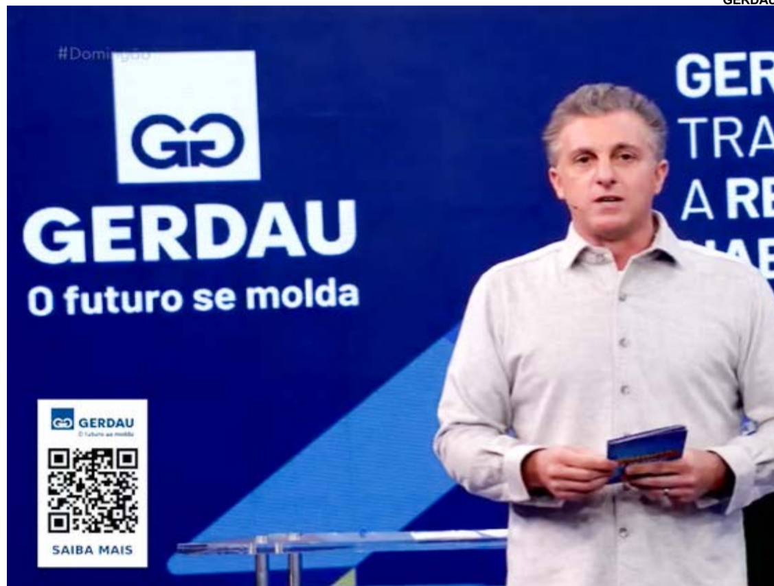
Domingão com Huck na TV Globo

“Esta é uma parceria inédita para uma indústria B2B, que vende um produto essencial para o nosso dia a dia, que é o aço. Buscamos continuamente ser uma marca B2P (Business to People), uma vez que somos uma empresa focada em pessoas e que vive seu propósito de empoderar pessoas que constroem o futuro. Aos 121 anos, queremos conectar cada vez