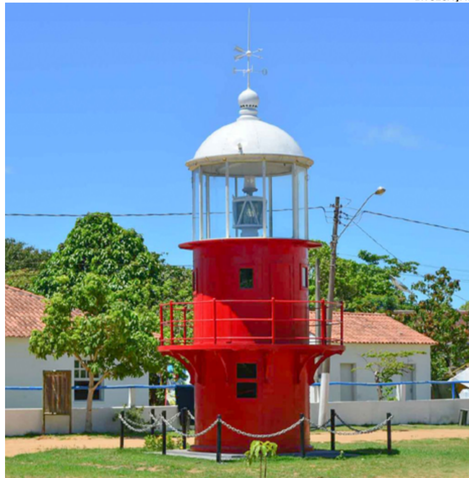
ANTIGO farol em Regência, ES: distrito também terá um banco comunitário

A comunidade acompanhará a execução dos recursos destinados à iniciativa e poderá usufruir, a princípio, de três linhas de crédito. O Banco oferecerá o Crédito Produtivo, para apoiar empreendedores e incentivar a criação de novos negócios; o Crédito Habitacional, destinado a pequenas obras; e o Crédito de Consumo, voltado à população de baixa renda e destinado ao atendimento a necessidades emergenciais das pessoas, como compras de remédios e alimentos.