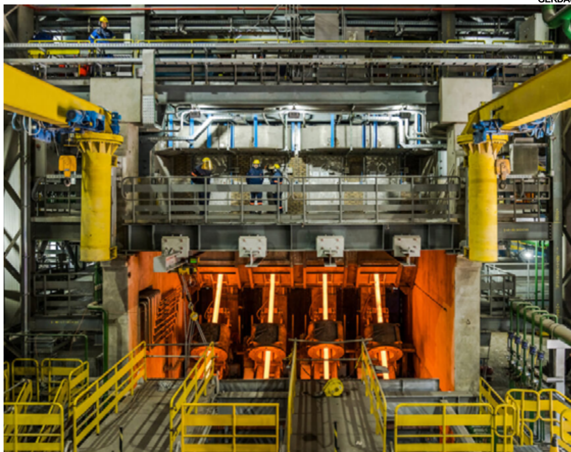
O NOVO equipamento da Gerdau já está em pleno funcionamento

Com investimento de aproximadamente R$ 700 milhões, o novo lingotamento trará ganhos em três frentes: 1) segurança, pois trata-se de um equipamento mais automatizado e moderno; 2) qualidade, pois o novo lingotamento possibilitará a produção de aços “clean steel”, cuja tecnologia aplicada dá ao produto mais limpeza e maior resistência, aumentando