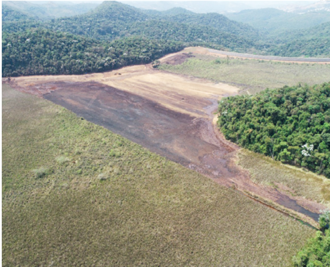
VISTA AÉREA do Dique Auxiliar da Barragem 5, na Mina Águas Claras, em Nova Lima (MG)