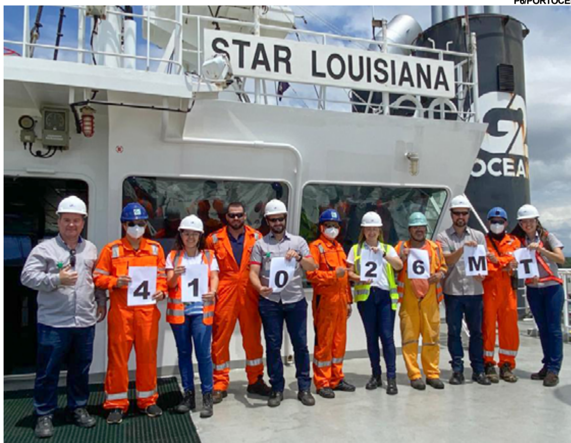
REGISTRO do momento em que a marca histórica foi alcançada no Portocel

Recentemente, Portocel concluiu investimentos da ordem de R$ 38 milhões em adequações para operação de novas cargas, incluindo a extensão do ramal ferroviário que chega ao porto e a cobertura de parte dos trilhos. O terminal também já responde por grande parte dos embarques de granito no Espírito Santo.