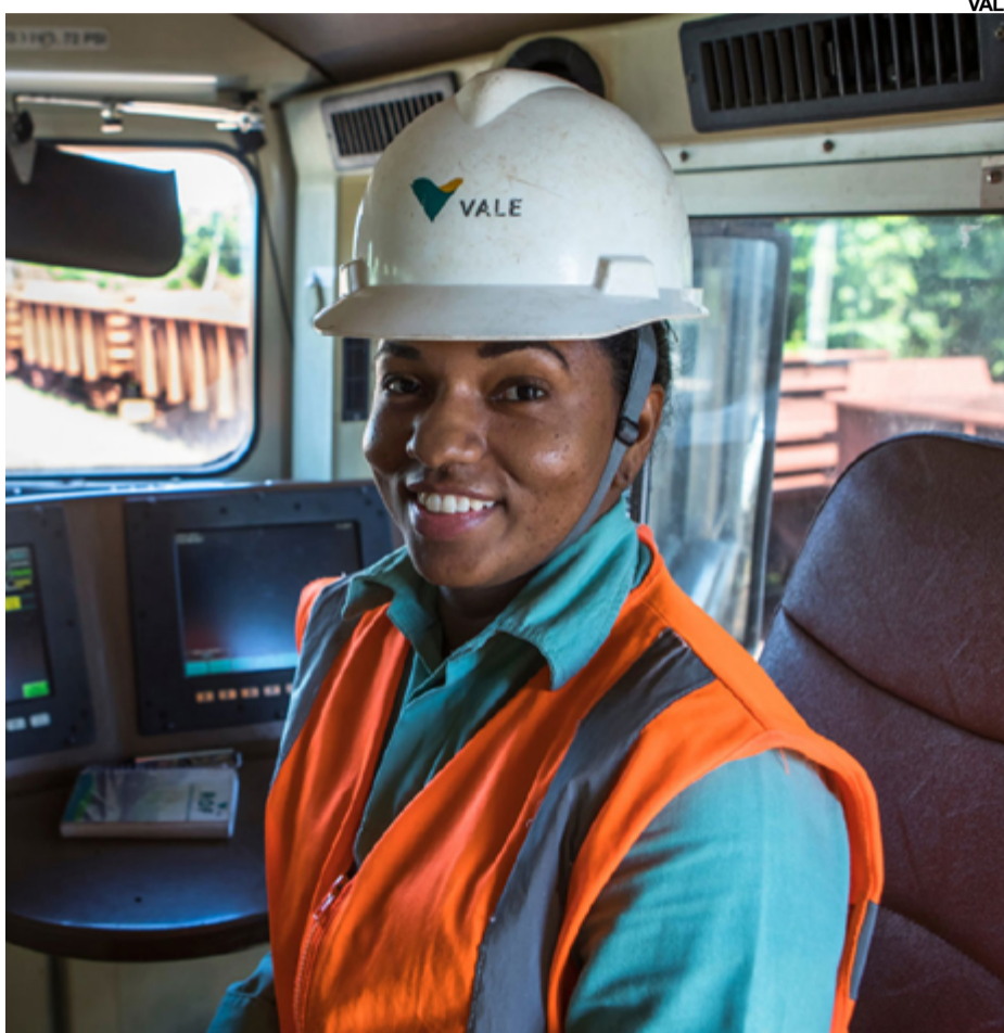
AS CANDIDATAS devem ser, de preferência, do ES, MA, MG, PA e RJ

“A Vale vem desenvolvendo diversas iniciativas de Diversidade, Equidade e Inclusão buscando contribuir para termos uma sociedade mais justa e com equi-