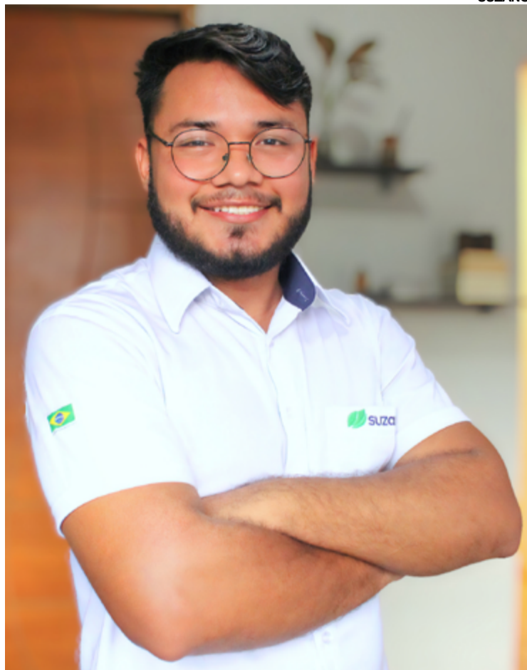
O PROGRAMA auxilia no desenvolvimento da carreira

São 110 vagas disponíveis nos estados do ES, SP, BA, CE, MA, MS e PA